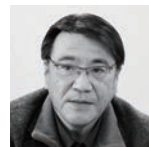
河野哲也 日本学術会議第一部会員、立教大学 教授