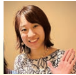
安田仁奈 日本学術会議連携会員、東京大学 教授