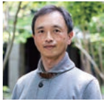
林健太郎 総合地球環境学研究所 教授